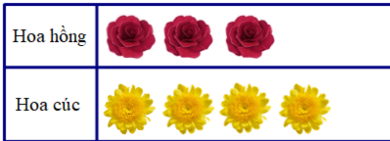
Số bông hoa đã nở trong vườn

Câu 4: Quan sát biểu đồ tranh sau rồi trả lời các câu hỏi: