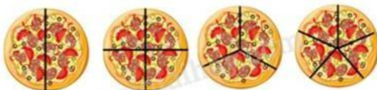
Hình 1 Hình 2 Hình 3 Hình 4

Câu 3. Hình vẽ nào dưới đây chia miếng bánh thành 5 phần bằng nhau?