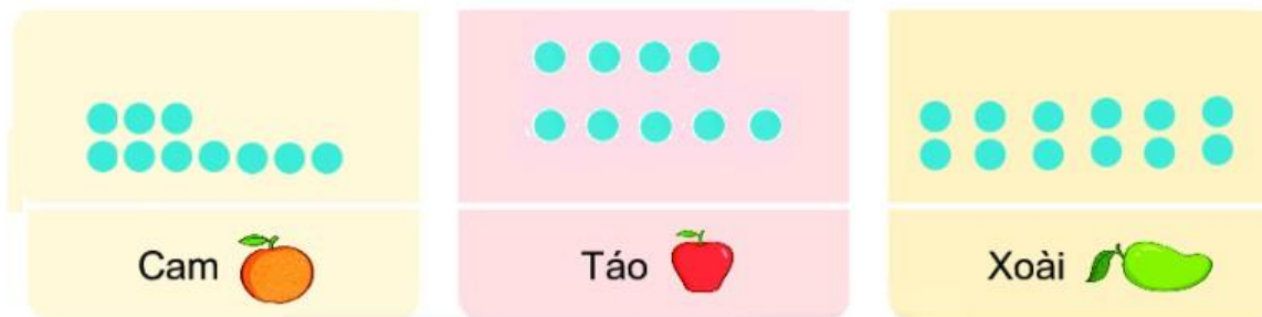
SỐ QUẢ CAM, TÁO, XOÀI TRONG BUỔI LIÊN HOAN

Câu 4. Cho biểu đồ về số quả cam, táo, xoài trong một bữa tiệc liên hoan: