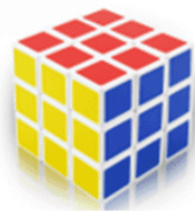
Khối rubik 21 000 đồng