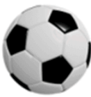
Quả bóng 77 000 đồng