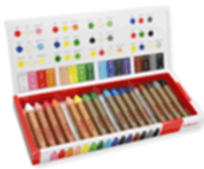
Hộp sáp màu 24 000 đồng