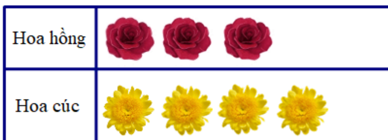
Số bông hoa đã nở trong vườn

Câu 4: Quan sát biểu đồ tranh sau rồi trả lời các câu hỏi: